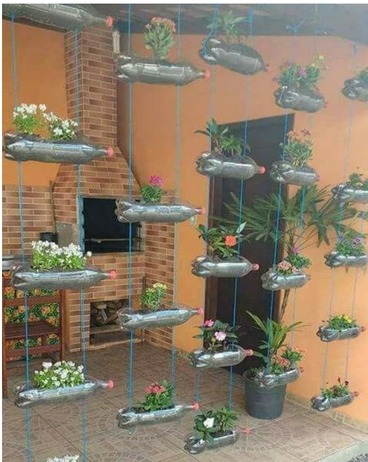
KORITA ZA ROŽE