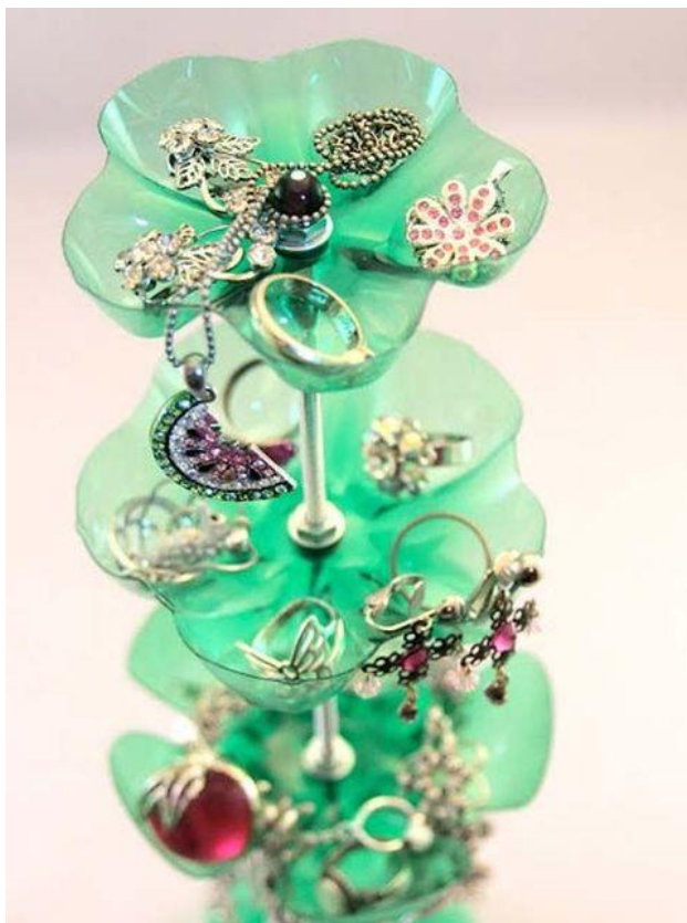
OBESALO ZA NAKI!