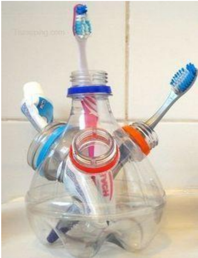
STOJALO ZA ZOBNE ŠČETKE